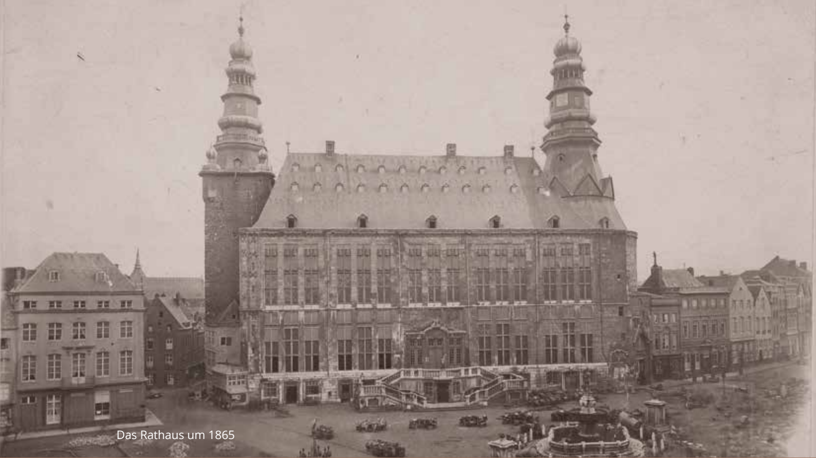
Das Rathaus um 1865