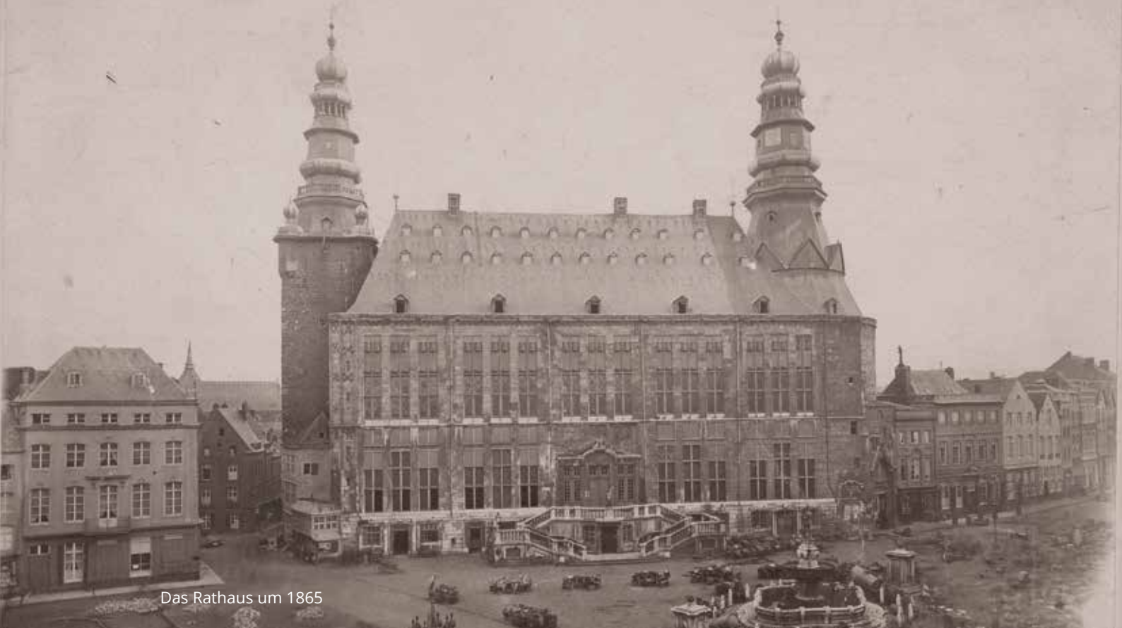
Das Rathaus um 1865